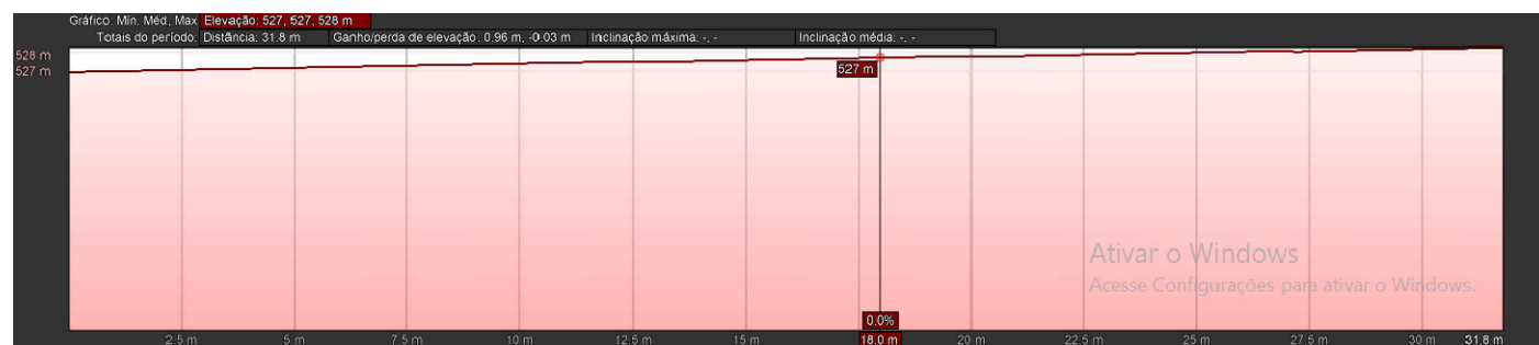
AV. SÃO PEDRO ESCALA: 1/500