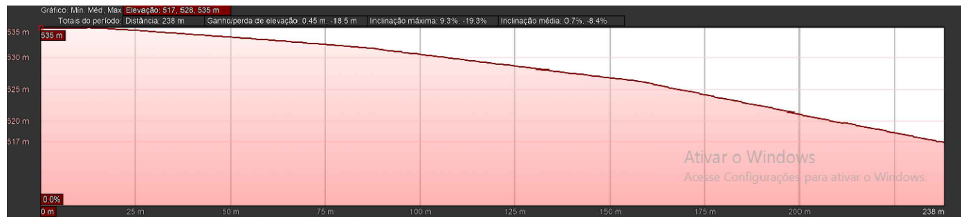
RUA ANGELO CENTENARO ESCALA: 1/500